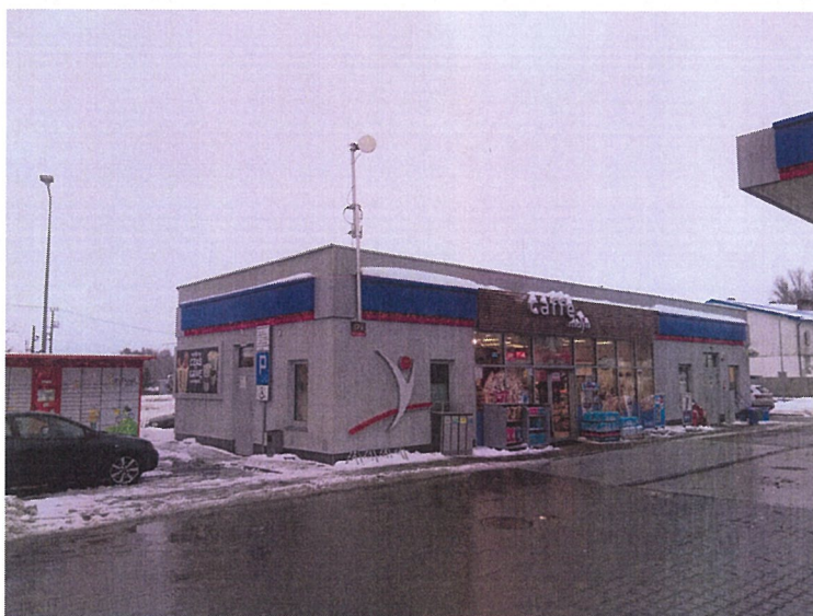
Widok obiektu wraz z zainstalowanym zespołem antenowym